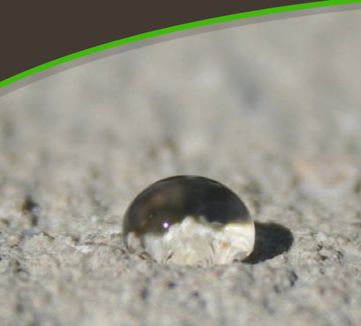
Absorción de Agua (%) - BSI 1881-122

Máxima Protección Impermeabilizante en Mezclas de Concreto No Aireado